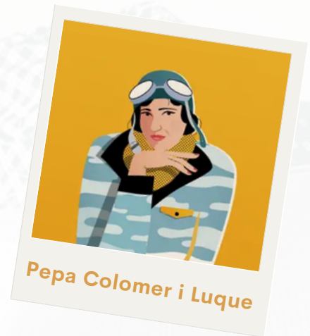
Pepa Colomer i Luque

Primera dona catalana amb llicència de pilot. En començar la Guerra Civil, va ser de les primeres a servir la República amb missions de vigilància, reconeixement i trasllat de ferits.