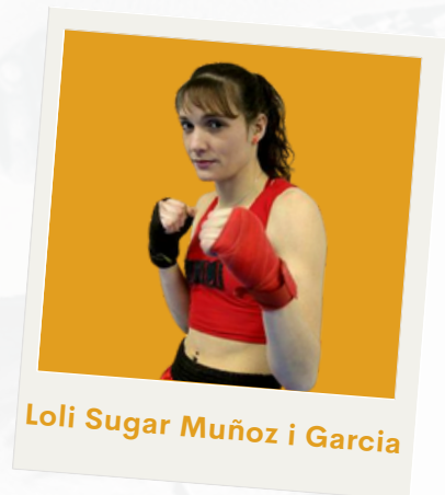
Loli Sugar Muñoz i Garcia

Llicenciada en matemàtiques però més coneguda en el món de l'esport al ser de les millors boxeadores del món durant els primers anys del segle XXI.